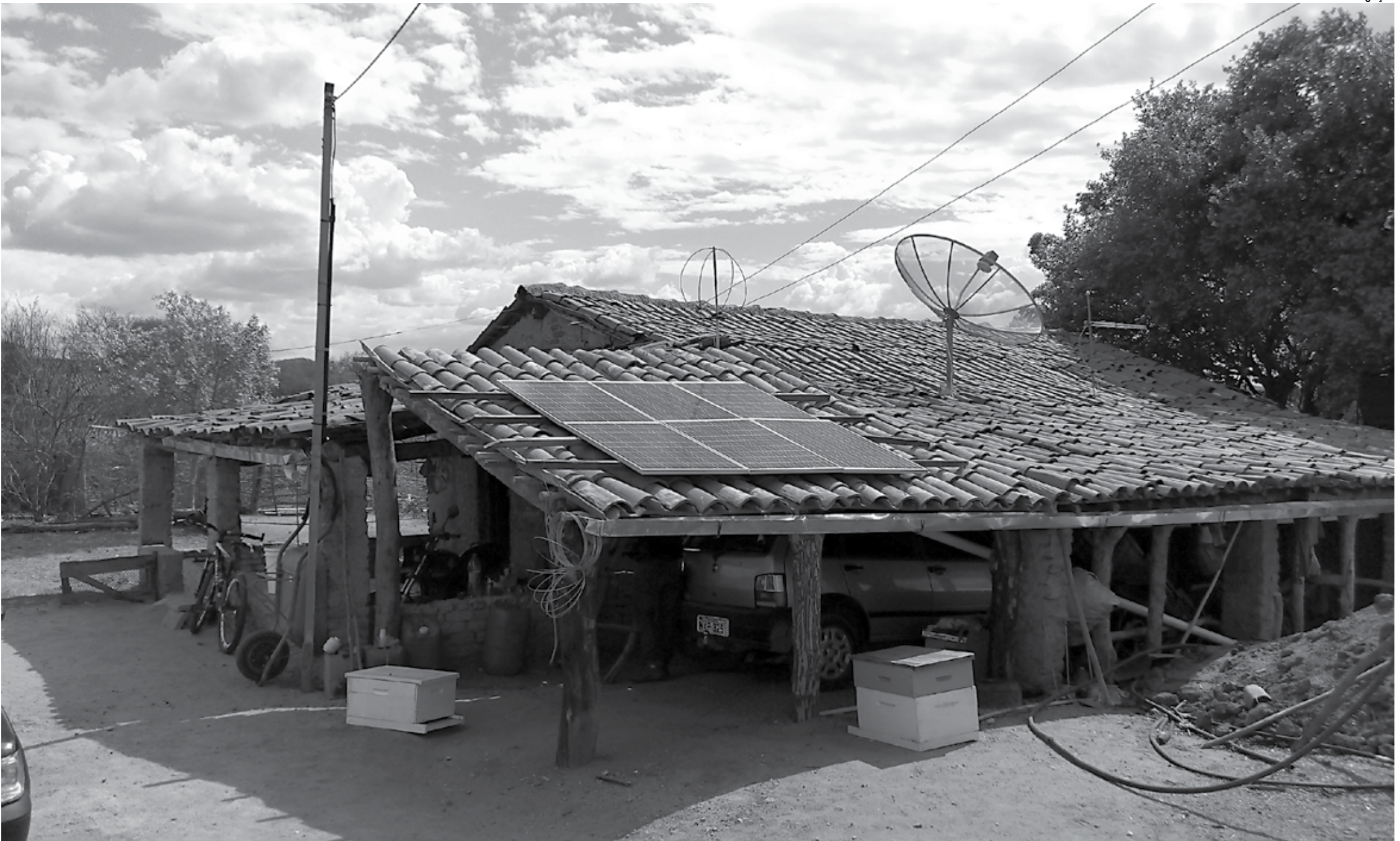
Projeto "Disseminação do uso de energia solar de forma comunitária e compartilhada" visa a capacitação técnica, aplicação e articulação política para o uso descentralizado de energia solar fotovoltaica em propriedades rurais