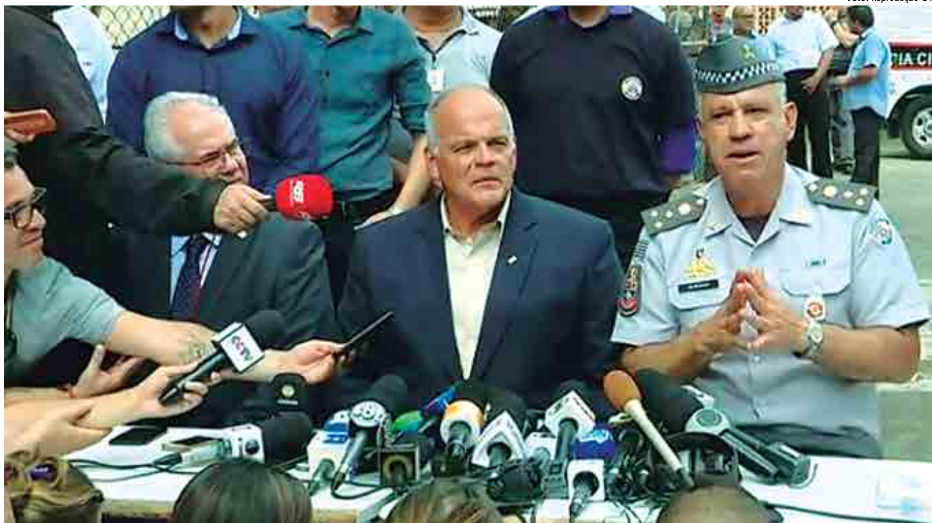
Secretário de Segurança Pública de São Paulo, João Camilo Pires de Campos (à esquerda), durante coletiva de imprensa no dia do massacre; mídia deve evitar uso excessivo da imagem dos atiradores