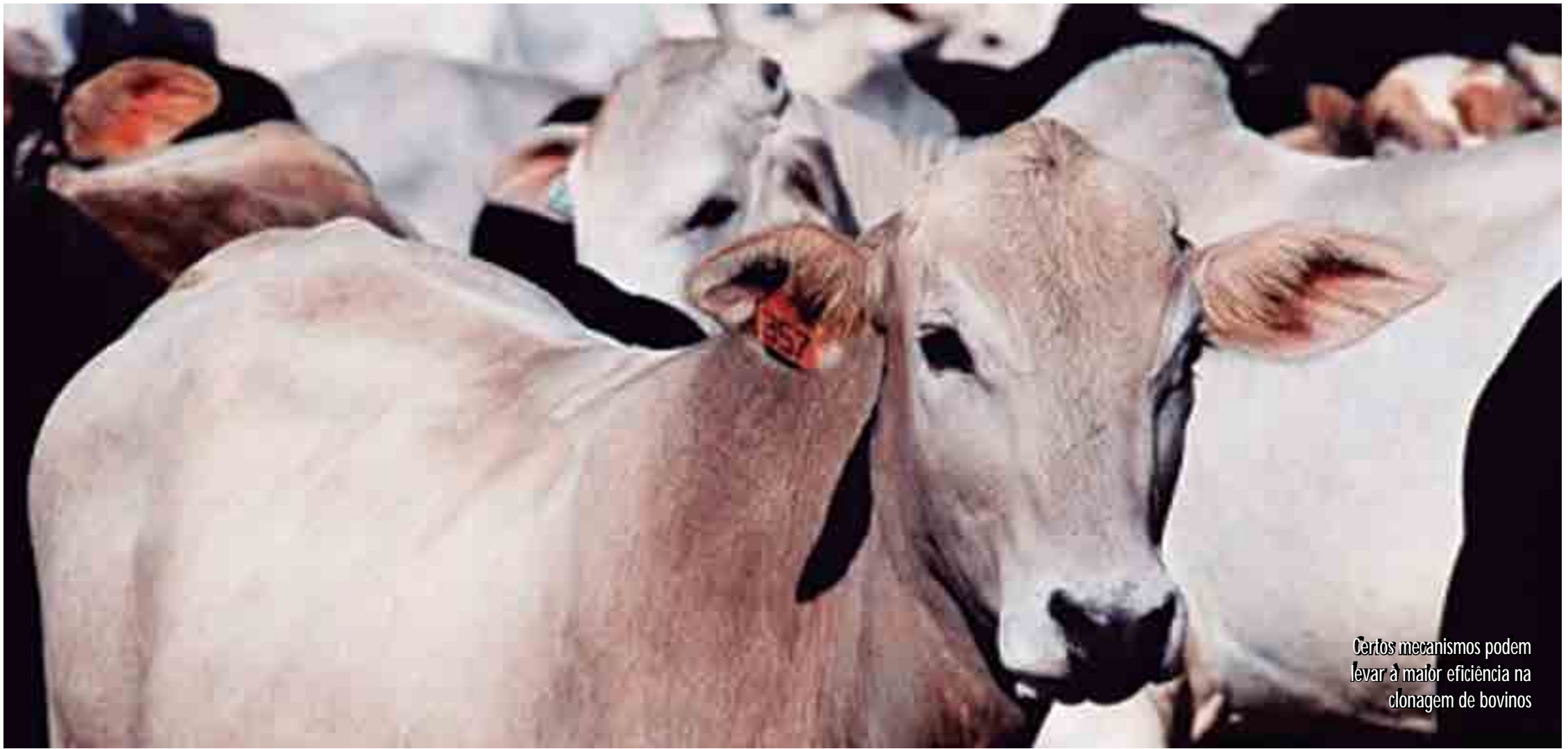
Certos mecanismos podem levar à maior eficiência na clonagem de bovinos