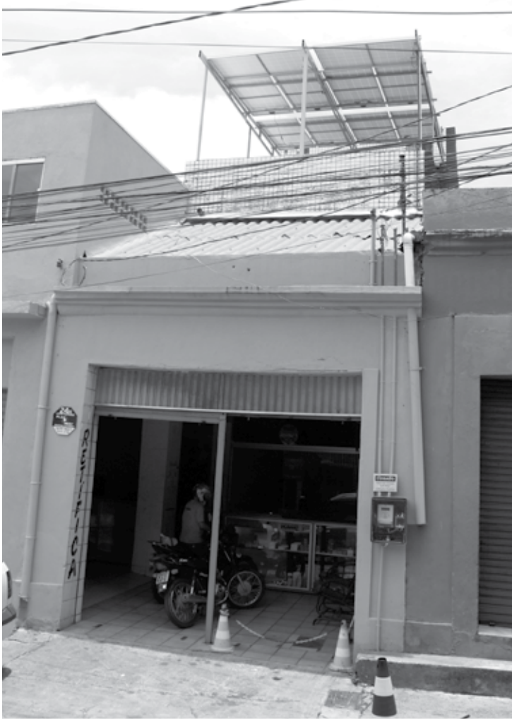
Na retífica, foram instalados 20 painéis solares, com potência de 330 watts cada