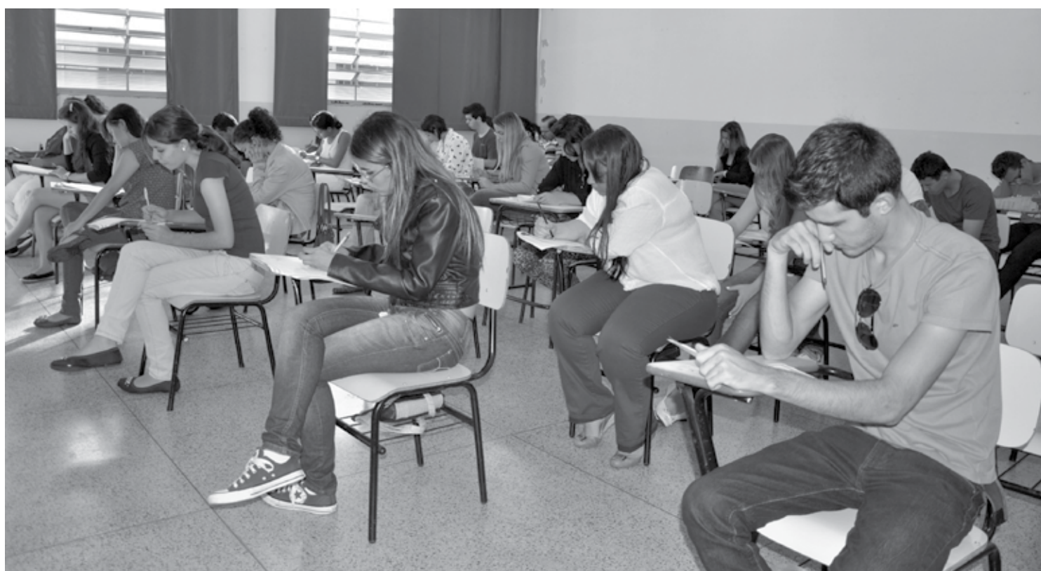
Caminha mais fácil é ficar atento aos editais das universidades públicas com períodos determinados de inscrição para o ingresso de quem já é graduado

Talvez os futuros números do Ibope, aferidos após a saída da musa do telejornalismo paraibano, mostrem um novo cenário na briga pela audiência na Paraíba. Se houver interesse e apreço de todas as emissoras pelo jornalismo de qualidade, o telespectador sai ganhando. Caso contrário, perdemos todos. Que a boa disputa prevaleça na telinha!