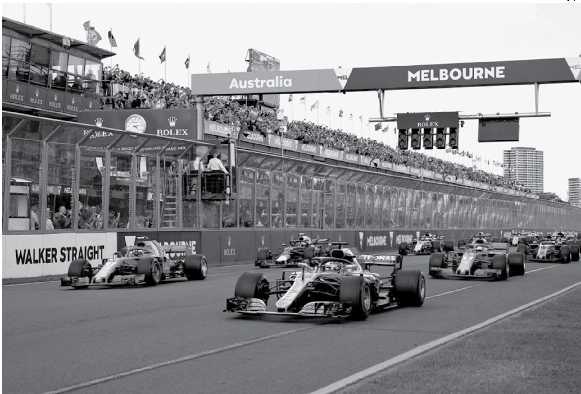
Sinal verde para o início de mais uma temporada de F1, que novamente deve ser protagonizada pelos carros da Mercedes e da Ferrari, além da RBR. O ano começa em Melbourne, na Austrália

Vettel, por sua vez, desconvosou quando perguntado pelo UOL Esporte sobre o que teria que fazer para começar a virar o jogo contra Hamilton. "Primeiro temos de saber onde nós estamos. Pode ser que a briga seja com a Red Bull por exemplo, ou com o Charles (Leclerc, seu companheiro na Ferrari), o que seria o melhor dos mundos! Mas, seja contra