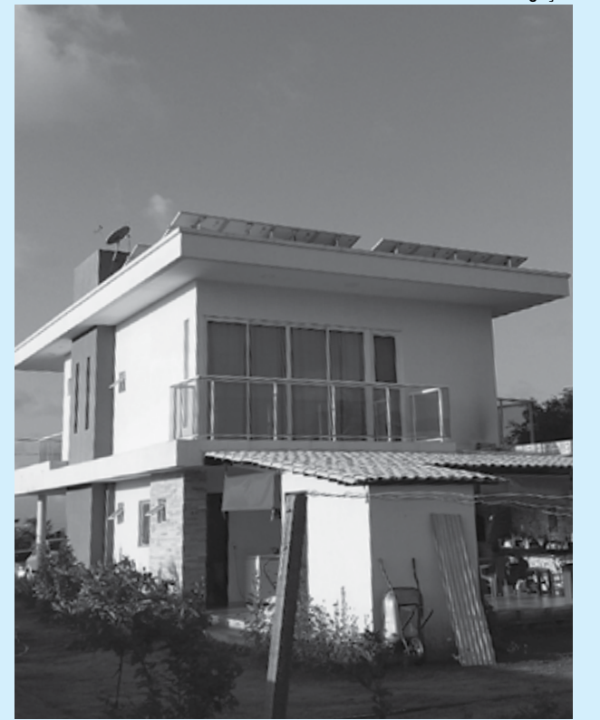
Casa em condomínio no Litoral Sul foi planejada para ser autossuficiente