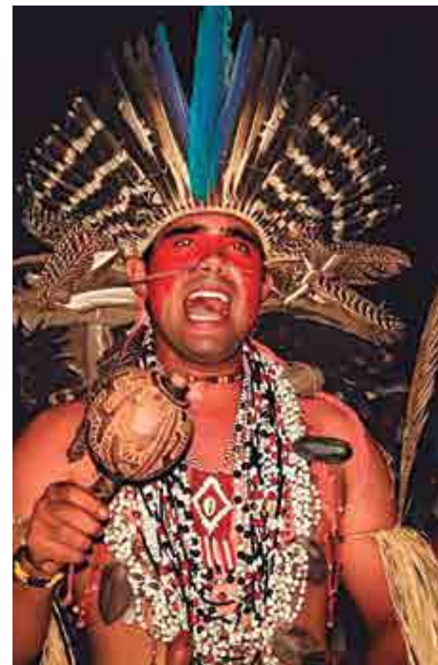
Enfeites e inúmeros colares são parte do ritual indígena