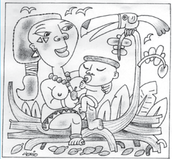
1-Brinco, 2 - Cabelo, 3 - Tatuagem (Rosto), 4 - Frutina(mão), 5 - Olhos, 6 - Bico do tucano, 7 - Folhas, 8 - Cabelo (Índio), 9 - Rabo do tucano.